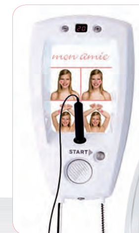
В стандартной комплектации с сенсором mon amie